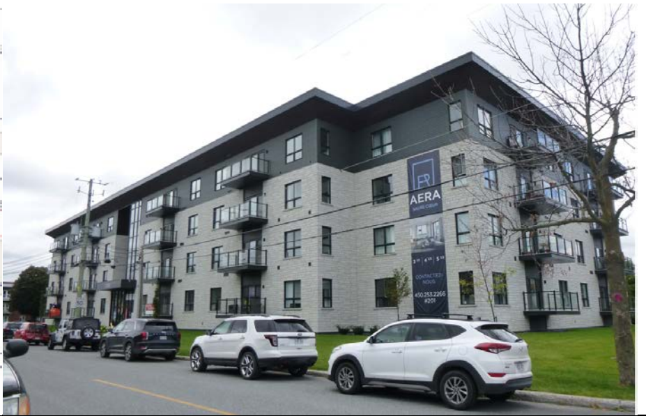
Localisation – Site à l'étude 2155, avenue Mailhot