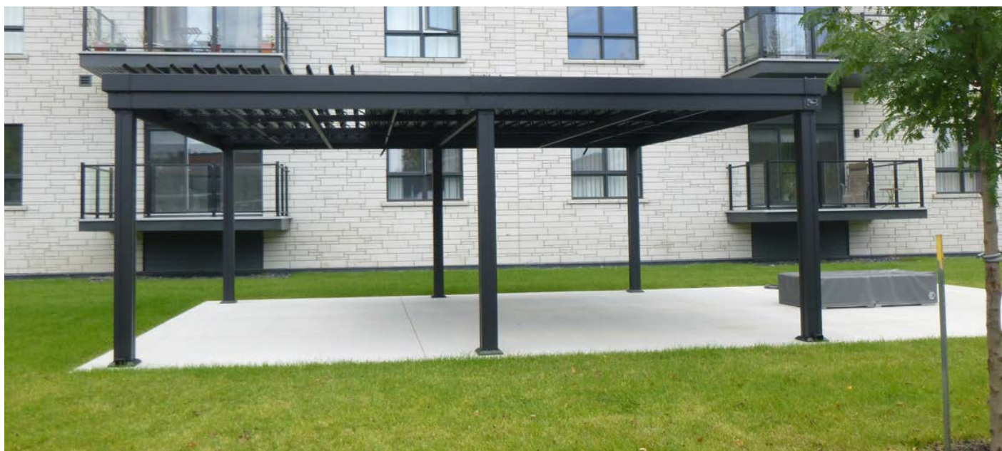
Cour avant secondaire – Rue Papineau 2155, avenue Mailhot